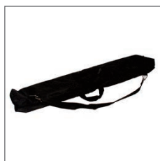
SAC DE TRANSPORT oile nylon renforcée